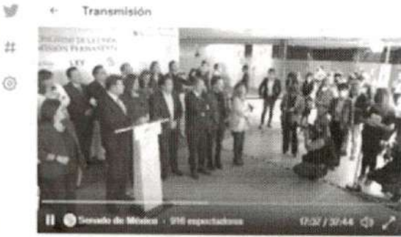
Senado de México @SenadoMexico Conferencia de prensa de legisladoras y legisladores del Grupo Parlamentario de Morena.