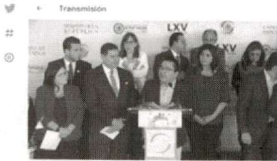
Confidencia de Morena @CONFIDENCIADEMORENA Conferencia de prensa de legisladoras y legisladores del Grupo Parlamentario de Morena.