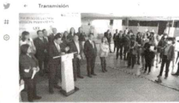
Senado de México @SenadoMexico Conferencia de prensa de legisladoras y legisladores del Grupo Parlamentario de Morena.